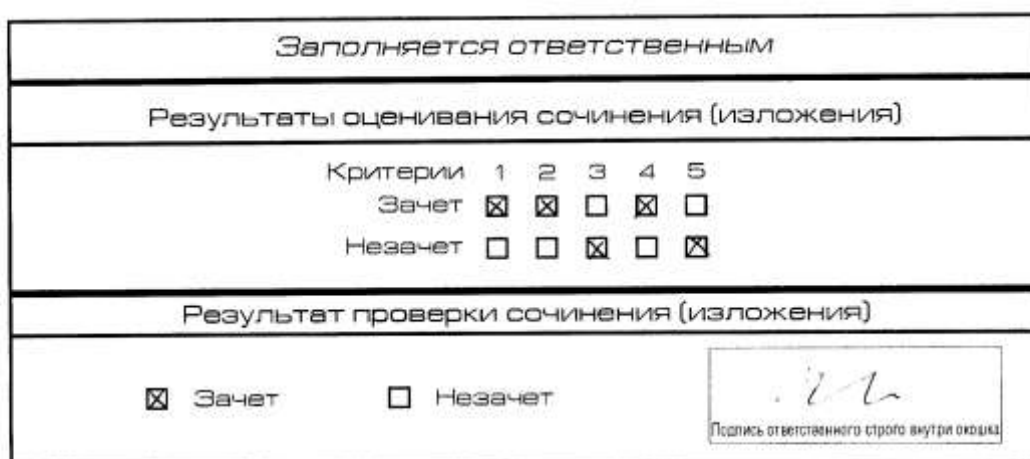
Рис. 5. Область для оценки работы.

Для каждого критерия должно быть помечено только одно поле – либо «Зачет» либо «Незачет».